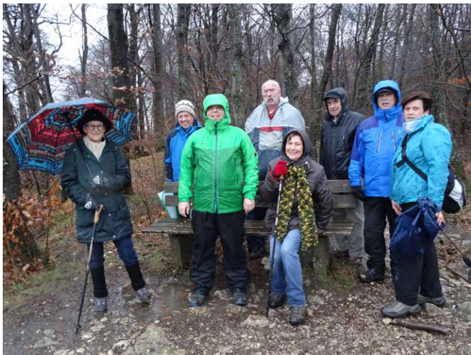
Bild: Jahresschlusswanderung - Löwenpfad Höhenrunde 09.12.2018