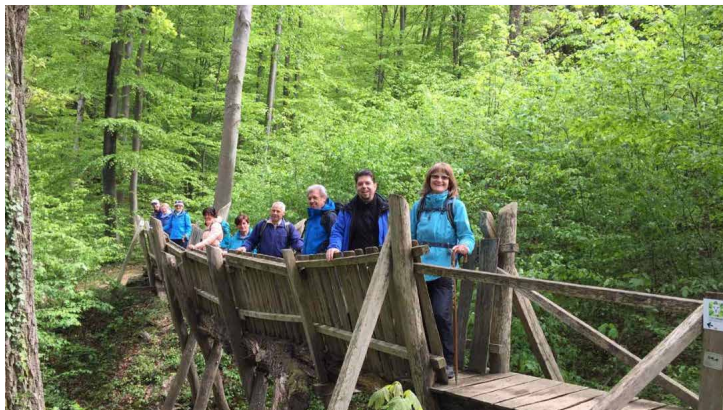
Bild: Auf dem Naturpfad Sinneswandel bei Bad Boll am 28.04.2019