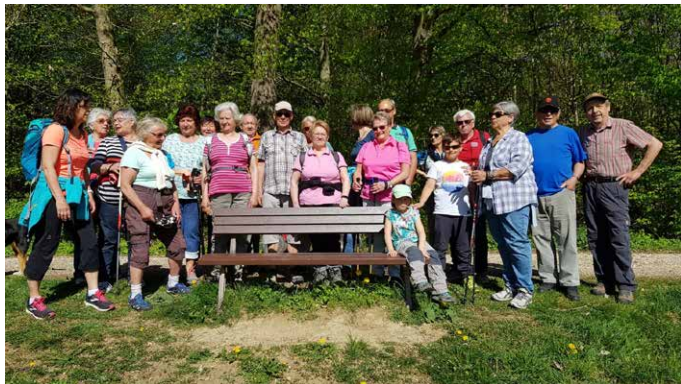
Bild: Ü60 Wanderung am 24.04.2019 bei Eschenbäche

Fr 01.05 Maifest im Hiltenburgsattel Die Ortsgruppe veranstaltet Ihr traditionelles Maifest an der Hiltenburghütte