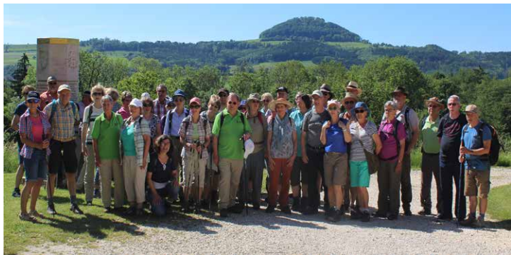
Bild: Auf der Stauferrunde mit der OG Wäschenbeuren - Filsgau