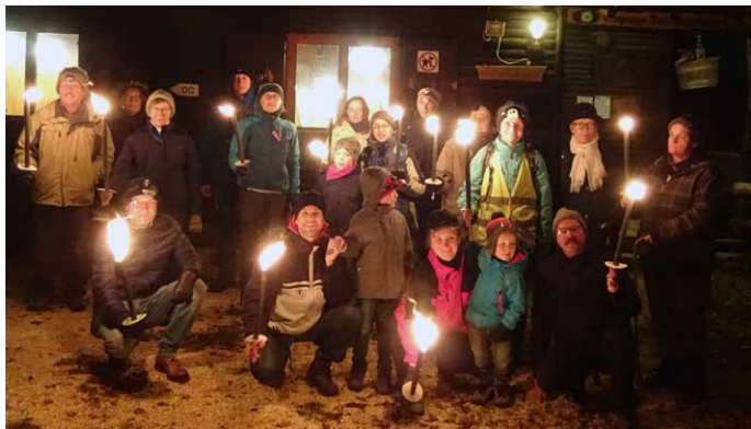
Bild: Fackelwanderung 22.11.2019 zur Hiltensburg