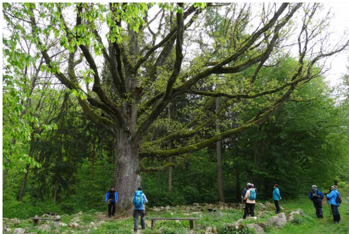
Bild: Auf dem Naturpfad Sinneswandel bei Bad Boll am 28.04.2019