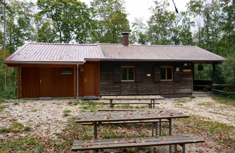
Hiltlenburghütte mit neuem Anbau