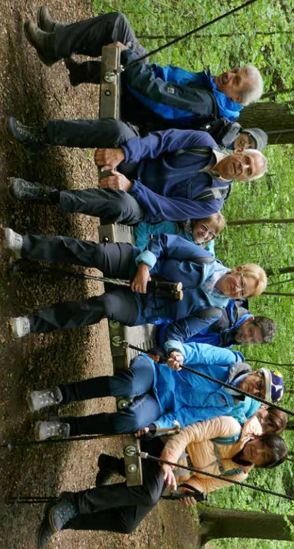
Auf dem Naturpfad Sinneswandel bei Bad Boll am 28.04.2019