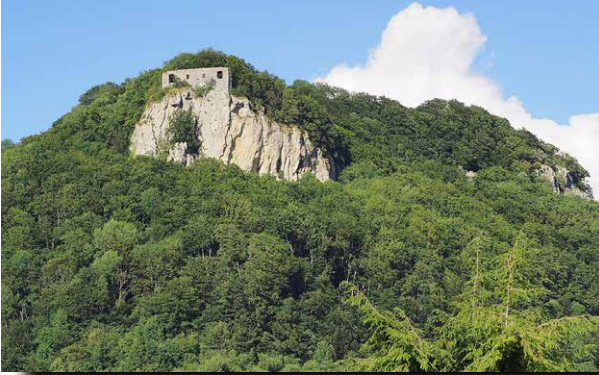
Bild: Rosenstein Westfels mit Ruine