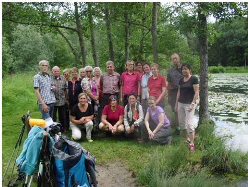
Bild: Wanderung durchs Siebenmühlental am 23.06.2019*