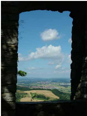
Bild: Blick durch ein Ruinenfenster