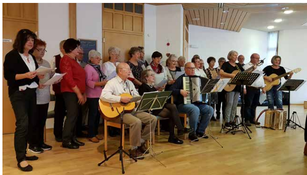
Bild: Jahresschlussfeier im Haus des Gastes am 14.12.2018