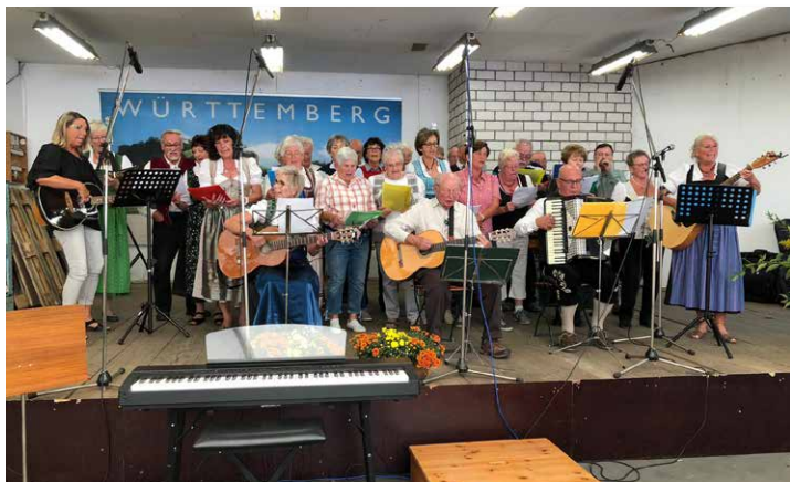
Bild: Die Singgruppe beim Uhlbacher Herbst am 07.09.2019