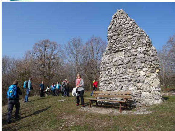
Bild: Nortlrunde - Zwischenstopp bei der Steinpyramide in der Nähe von Auendorf am 24.03.2019