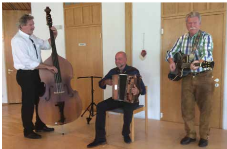
Bild: Musikantentreff am 27.10.2019 im Haus des Gastes