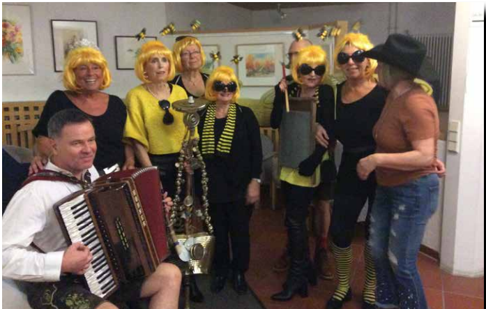
Bild: SAV Fasching 26.02.2019