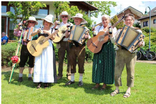
Bild: Vatertagshock mit Musikantentreffen am 30.05.2019 im Haus des Gastes