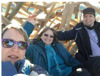
Bilder: Das Kugelnest lädt zum Verweilen ein, bei der Wanderung rund um Uhingen am 24.02.2019